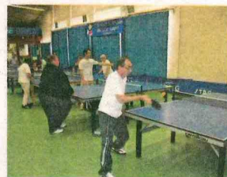
En pleine comp tition.